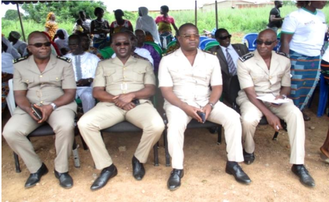
Corps préfectoral de la remise de matériel médical aux structures sanitaires du nord

gamme du matériel qui se situe au-delà des espérances. Ils ont salué l'acte qui vient à propos, en soutien à la politique de couverture maladie universelle du Chef de l'État.