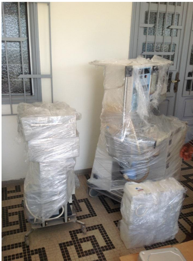
Un échantillon du matériel médical offert au CHU de Treichville le 07mai 2015