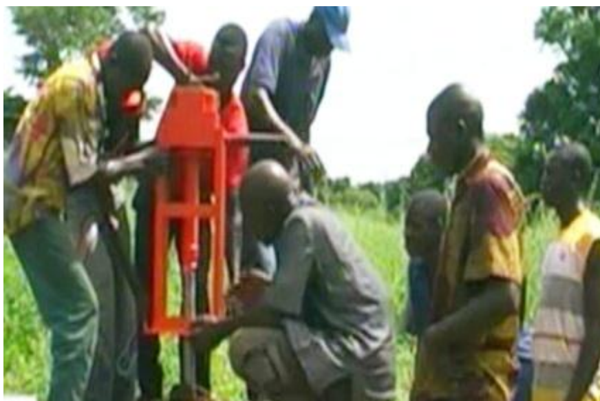
Remplacement d'une pompe par les artisans réparateurs de L'ONG

Le budget global de réparation a été estimé à 2 247 000 FCFA, financé grâce aux cotisations levées auprès des membres de l'ONG. Une fois les fonds réunis, les réparations ont été exécutées dans la période du 20 au 26 octobre 2015.