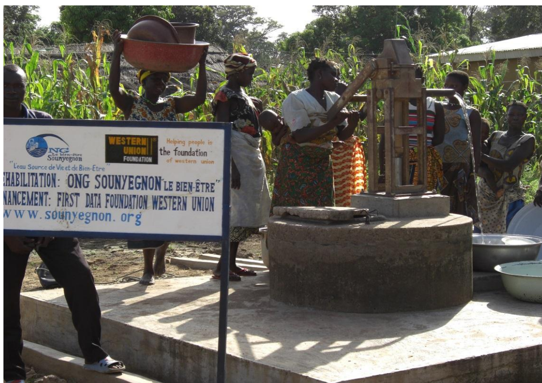
Utilisation d'une pompe après réparation par l'ONG Sounyegnon