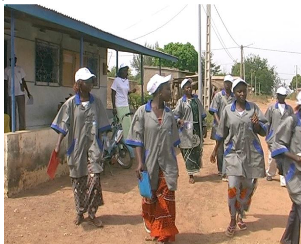
Les animatrices de l'ONG SOUNYENON lors d'une campagne

Les personnes sensibilisées par les EP sont en général référées vers les centres de dépistage.