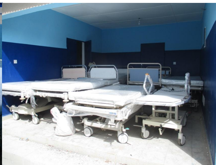
Lits électriques offerts aux structures sanitaires du nord le 14 octobre 2015