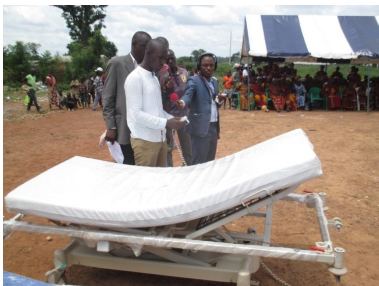
Démonstration du fonctionnement de lits électriques offerts aux structures sanitaires du nord