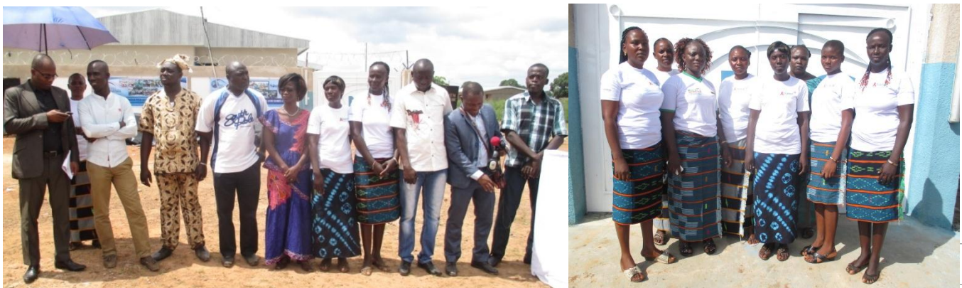
Le personnel de l'ONG SOUNYEGNON

Le présent document retrace les activités menées par l'ONG Sounyegnon au cours de l'année 2015 dans la Région du Nord et à Abidjan.