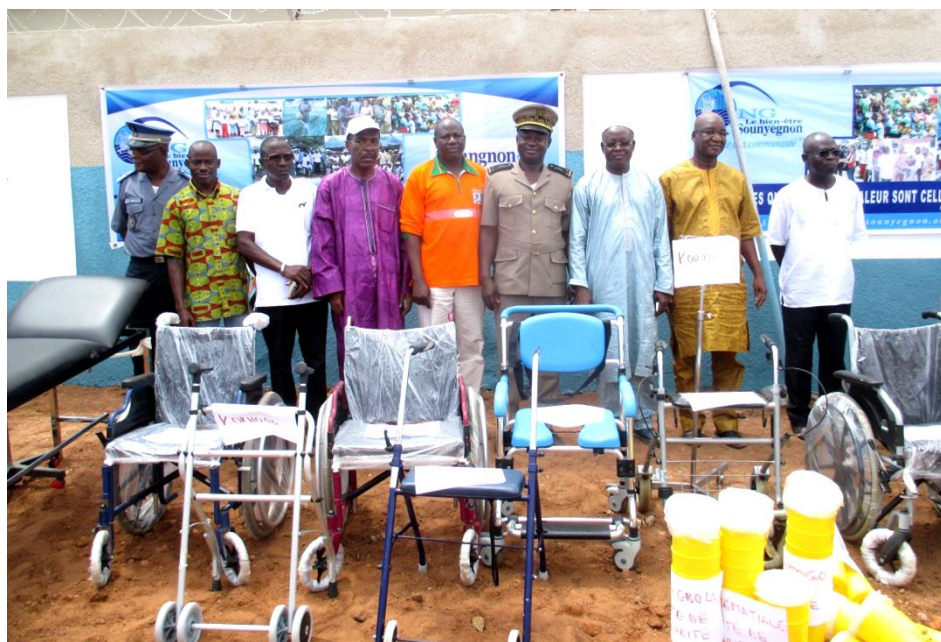
Remise symbolique du matériel médical aux structures sanitaires du nord (le 14 Octobre 2015 à Sinématiali)